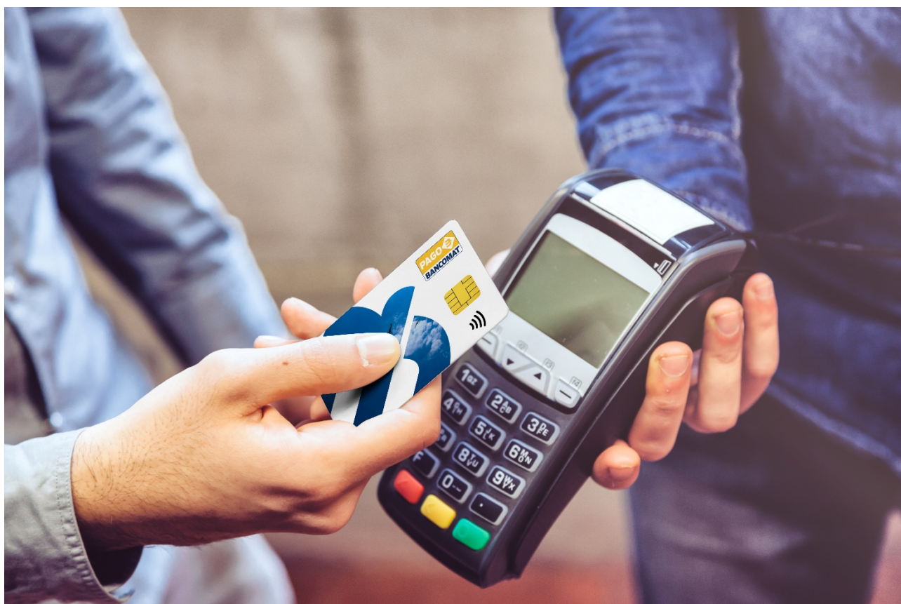
Pagamento su POS con carta PagoBANCOMAT® - Picture 2