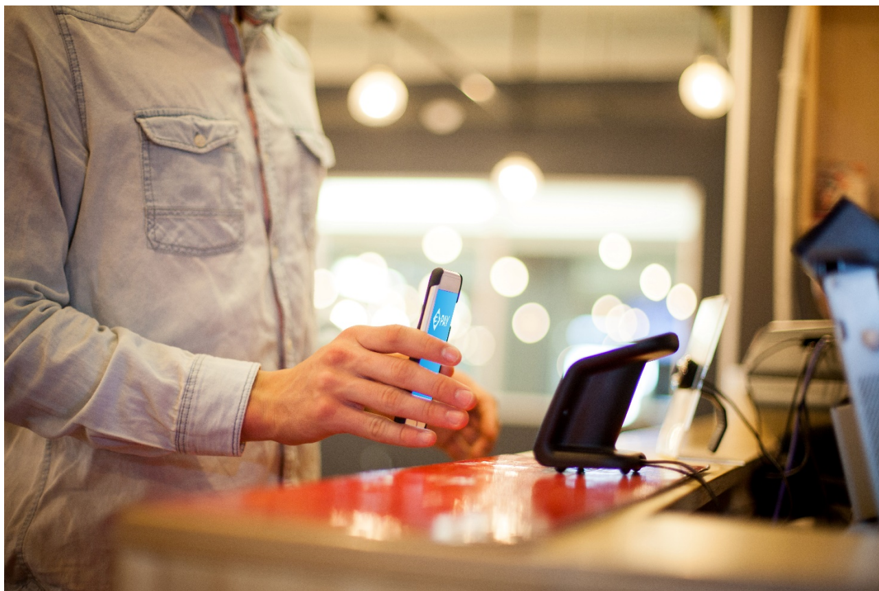
Pagamento con BANCOMAT Pay® - Picture 1