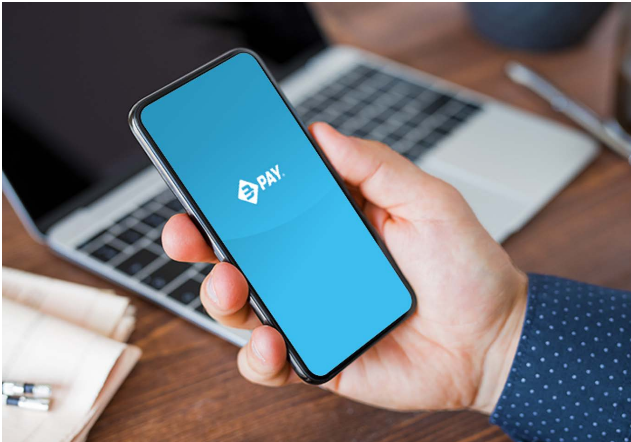
Splash BANCOMAT Pay® - Picture 4