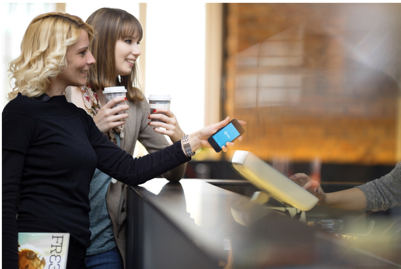
Pagamento con BANCOMAT Pay® - Picture 2