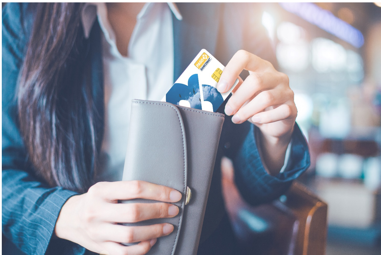
Carta PagoBANCOMAT® - Picture 1