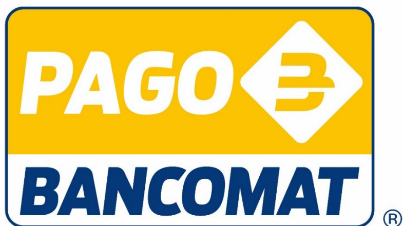
Logo PagoBANCOMAT® – Versione Card