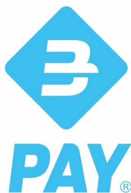
Logo BANCOMAT Pay® – Versione compatta verticale