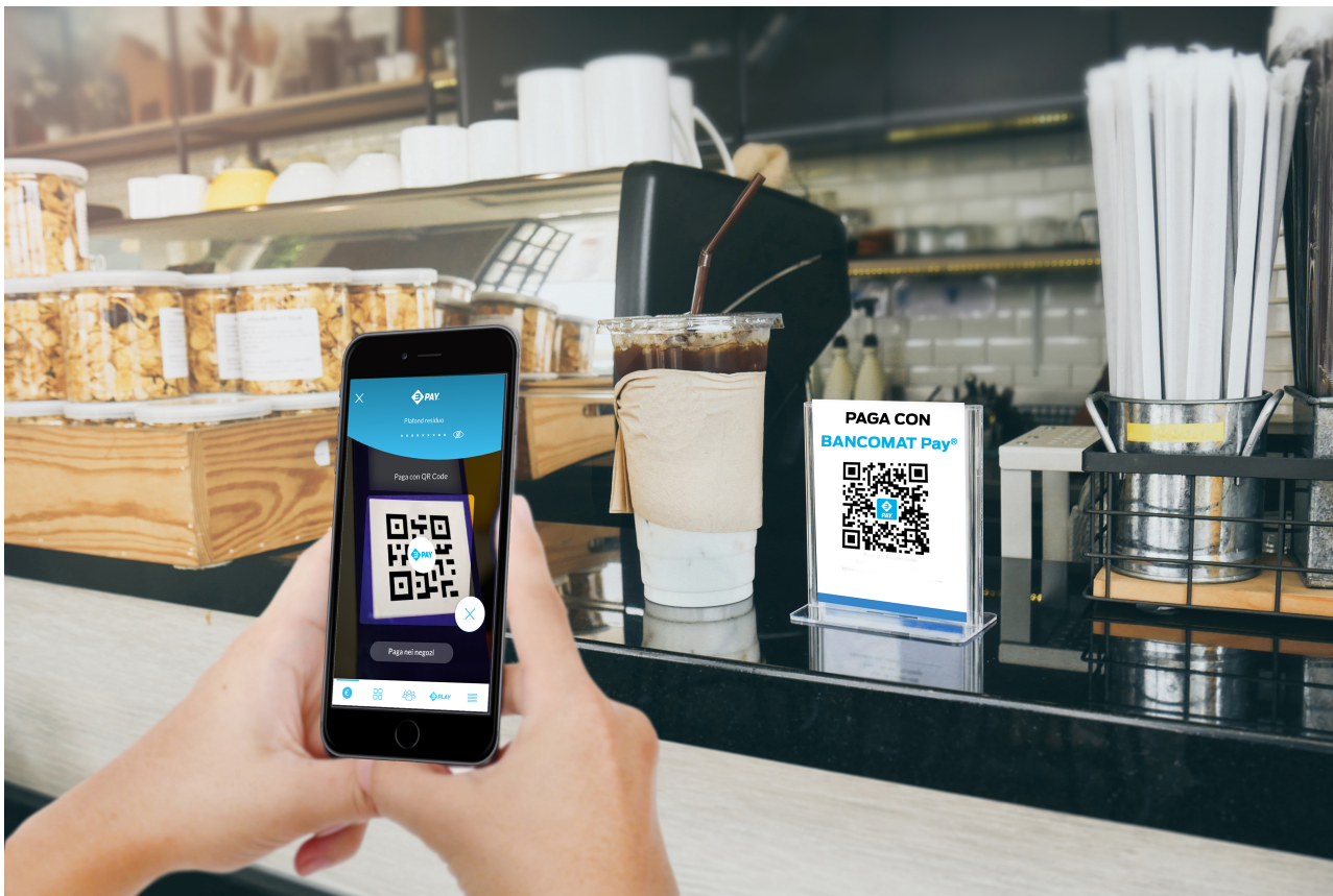
Pagamento Qr-Code con BANCOMAT Pay® - Picture 3